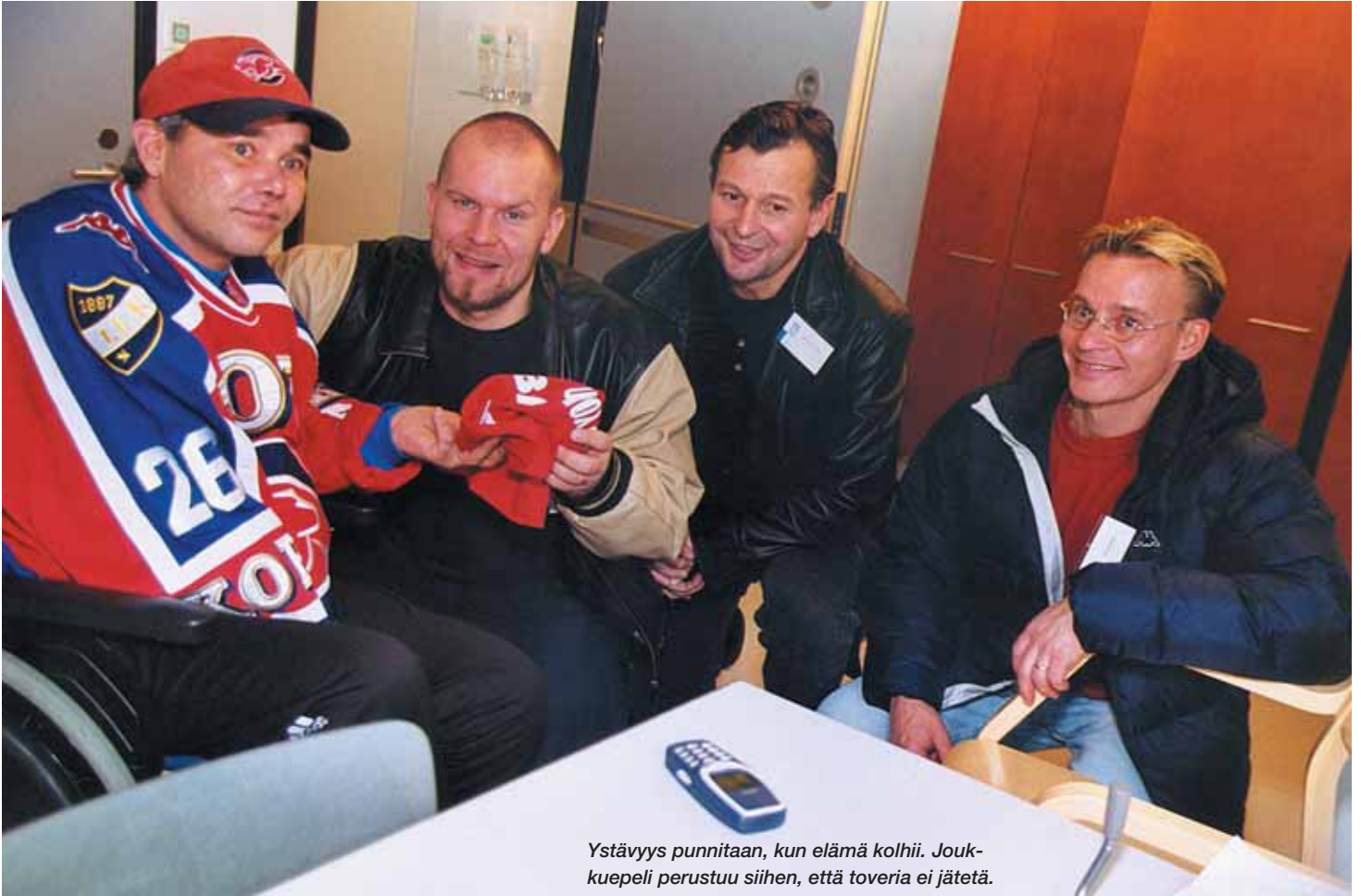
Ystävyys punnitaan, kun elämä kolhii. Joukkuepeli perustuu siihen, että toveria ei jätetä.